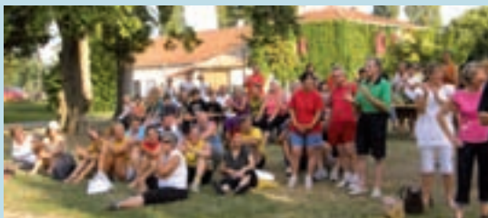
Annnonce des résultats au château Martinière - Défi Sport 2008.

■ dimanche 12 septembre : Cette journée est réservée aux compétitions officielles. Si certains clubs souhaitent organiser des rencontres amicales, ils peuvent prendre contact avec Serge Nespoli au 05 57 32 91 48.