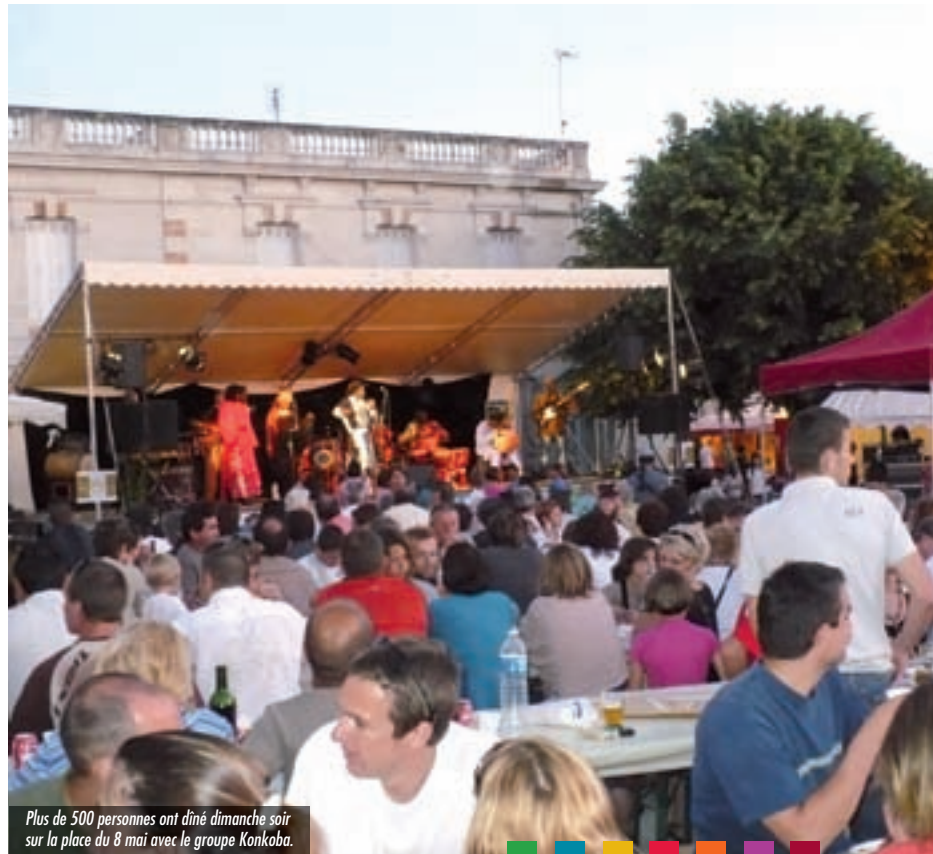
Plus de 500 personnes ont dîné dimanche soir sur la place du 8 mai avec le groupe Konkoba.