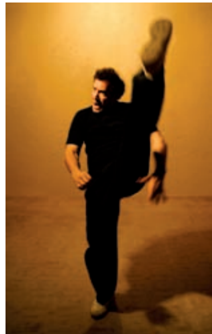
Johnny Clegg en tournée.

Vente des billets aux points de vente habituels : Médiathèque, Tabac Saint-Ciers, Fnac et Virgin