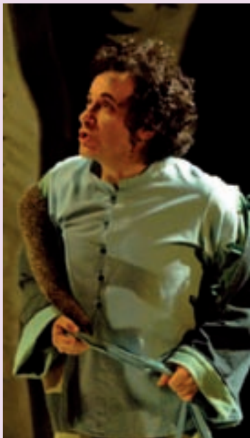
L'Ogrelet en représentation.

Fête de la Saint-Fiacre (bal des pompiers, fête foraine, marché de nuit par les commerçants et feu d'artifice).