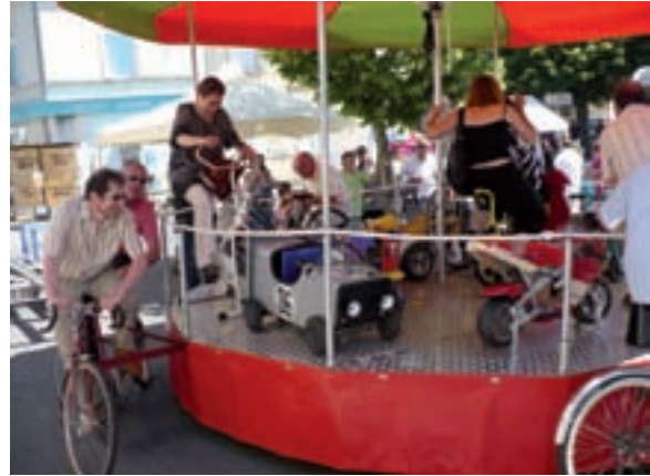
L'éco-manège a remporté un vif succès auprès des petits et des grands enfants.