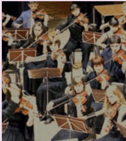
Orchestre Symphonique des jeunes de la Volga

Festival Eurochestreries 2009 à la Salle des Fêtes de Saint-Ciers. Orchestre Symphonique des Jeunes de la Volga (Russie, Kazakhstan, Ouzbékistan, Biélorussie, Turkménistan). Cet orchestre est composé de jeunes musiciens âgés de 15 à 23 ans, la plupart lauréats de concours nationaux et internationaux.