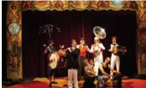
Le cirque Oups.