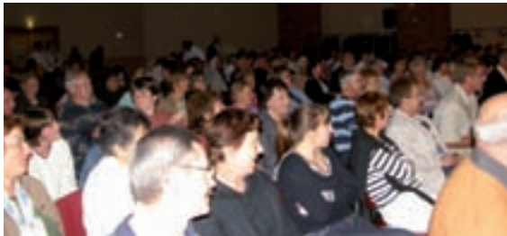
Le public est venu en nombre écouter et applaudir les jeunes québécois de l'ensemble orchestral Harmonie de la Cité de Vaudreuil.