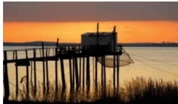
Un carrelet.