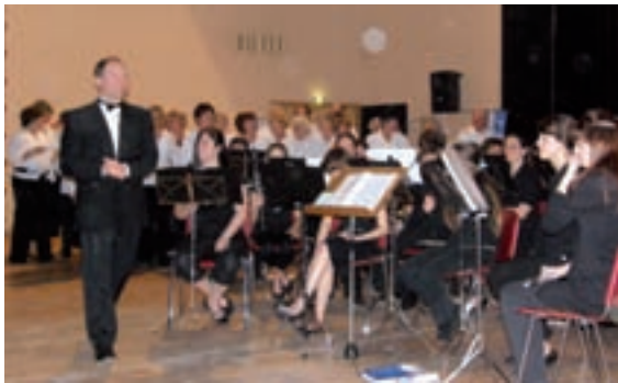
Arrivée du chef d'orchestre Marc-André Thibault sous les applaudissements d'un public déjà conquis.

Le chef d'orchestre, Marc-André Thibault et les 50 jeunes de 12 à 19 ans, ont interprété magistralement un programme très varié, allant d'une pièce de musique enchanteresse et mystérieuse du compositeur autrichien Otto Schwarz, « Le Comte de Monte Cristo », à la bande musicale du film « Pirates des Caraïbes 3 », en passant par Ennio Morricone et 3 titres de Charles Aznavour ! Un pur moment de bonheur à la salle de spectacles !