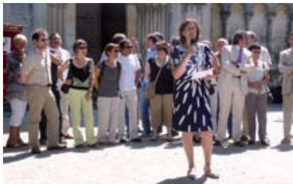
Inauguration officielle le 31 mai en présence du député Philippe Plisson, des maires du canton et des conseillers municipaux.