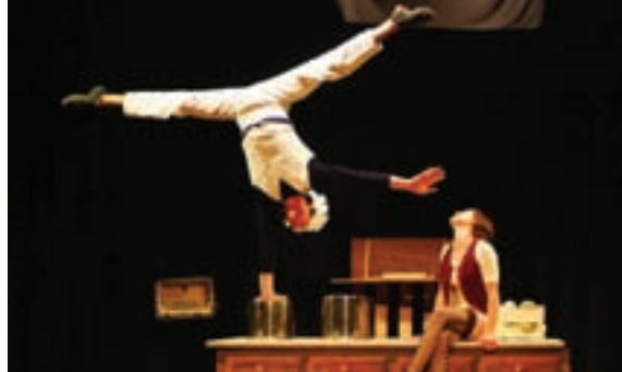
Acrobaties du cirque Oups.