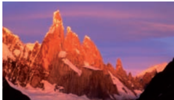
Paysage d'Amérique du Sud, par Guillaume Guist'hau.

Renseignements Médiathèque : 05 57 32 84 36 mediatheque.st-ciers-gironde@wanadoo.fr