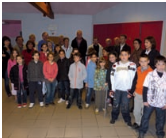
Mise en place du conseil municipal des enfants en présence des élus municipaux, le 30 avril 2009.

Mettre en place un Conseil municipal des enfants, c'est donner aux jeunes l'occasion de s'exprimer et les aider à devenir acteurs de leur citoyenneté, pour faire face ensemble aux problèmes actuels, pour découvrir la gestion communale et apprendre la démocratie, pour connaître la frustration et la patience. C'est offrir une possibilité d'échanges et de confrontation, en vue de mieux réfléchir, mieux se faire entendre, améliorer aussi sa propre écoute et partager.