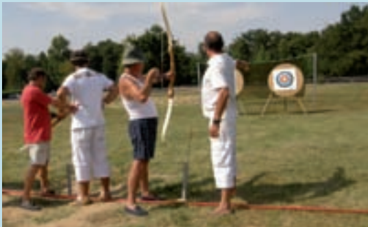
Initiation au tir à l'arc - Défi sport 2008.

Le concours de tir à la corde au château Martinière aura lieu en soirée comme l'année précédente, suivi d'une remise de trophées aux associations et aux sportifs désignés par les clubs, puis d'un vin d'honneur. Un repas et un bal champêtres clôtureront cette journée.