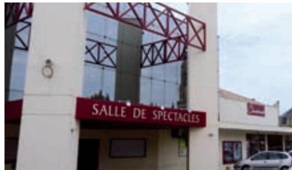
Salle de spectacles

Le budget 2009 nous contraint à des économies conséquentes sur les dépenses de fonctionnement, et ce, d'autant plus que le contexte de crise risque d'aggraver la situation des collectivités.