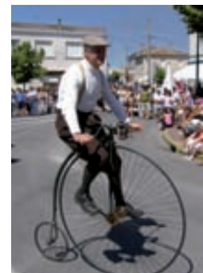
Animations de rue.

africain. Musique, chants et danse, la convivialité était bien au rendez-vous pour le plaisir de tous. Le lundi après-midi, le défilé carnavalesque a attiré, une fois encore, une foule impressionnante de passionnés. C'est grâce à l'investissement important du comité de foire, du personnel communal, des élus, des associations et des bénévoles que ces deux jours ont été une réussite collective. Rendez-vous l'année prochaine !